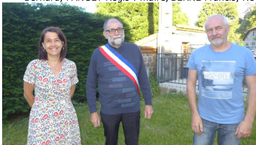
Le Maire et les adjoints.