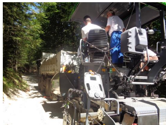
Travaux chemin de la Crapaudière

L'ensemble de ces travaux ont représenté une dépense totale de 81 648 Euros HT.