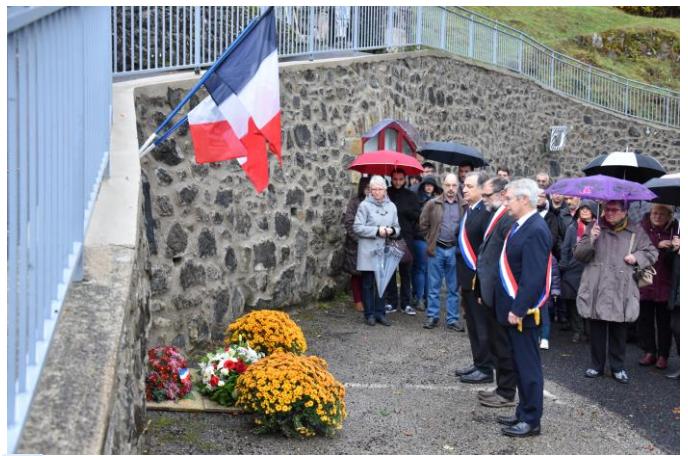
M le Député, M le Sénateur

Les camarades d'Alexandre lors de la plantation de l'arbre souvenir.