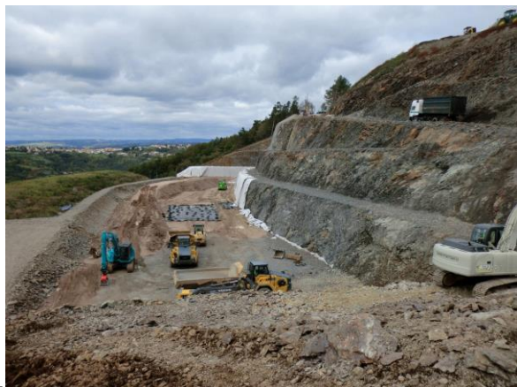
L'Installation de Stockage des Déchets non Dangereux (ISDND)

Afin de trouver une alternative à l'enfouissement des déchets sur son site, le SICTOM a lancé un appel d'offres pour le traitement des Ordures Ménagères (7 700 T/an) mi-octobre. Le coût de ce traitement est estimé entre 75€/T et 110€/T, soit un montant estimatif annuel de traitement compris entre 577 500 € et 847 000 €. A ce coût, s'ajoutent les frais de transport des ordures ménagères sur le site de traitement, lesquels sont estimés à 100 000 €/an. Simultanément, une consultation pour le traitement des encombrants est lancée afin d'avoir une solution de repli si la réhausse n'est pas acceptée par les services de l'Etat, ou jugée trop contraignante financièrement et/ou techniquement.