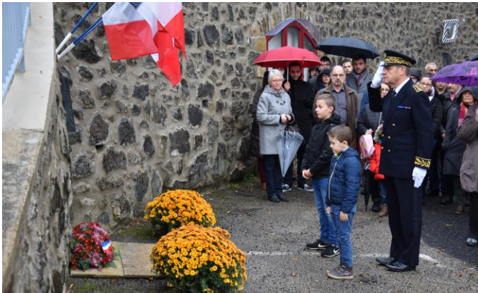
M le Secrétaire General de la Préfecture

Cette année les cérémonies se sont déroulées sur la place Philippe Serindat. Un ensemble de photos retrace cette journée où nous avons accueilli de nombreuses personnalités. Un grand merci au 3 e régiment d'hélicoptères de combat de L'ALAT (aviation légère de l'armée de terre) qui a fait le déplacement depuis Etain, dans la Meuse.