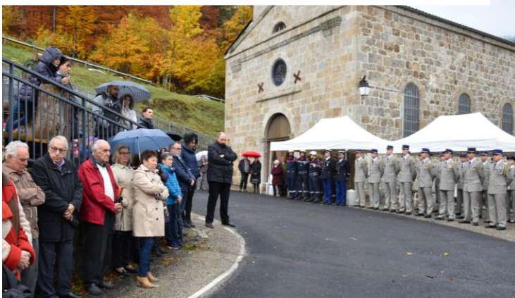
Un public nombreux, un détachement des sapeurs-pompiers, de la gendarmerie, du 3 e régiment d'Etain

Les camarades d'Alexandre lors de la plantation de l'arbre souvenir.